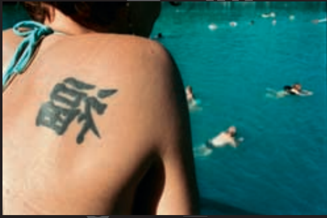
BUDAPEST capitale de la Hongrie vue par MATTIAS COSTA