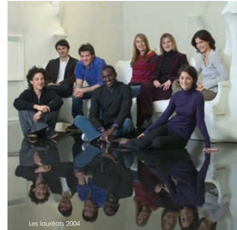
Les lauréats 2004