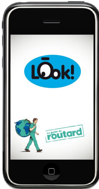
Nom et marque de l'application