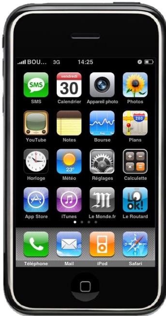
Look ! Le Guide du routard