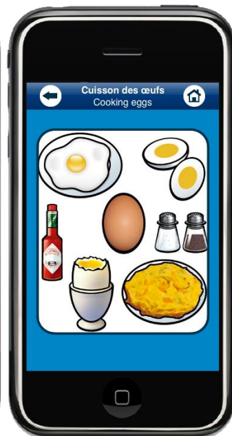
Planche ayant un lien avec le zoom « œuf sur le plat » (cf. écran 9).